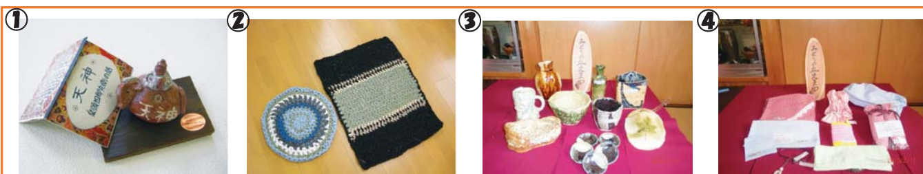
①、②みどりの丘の自主製品